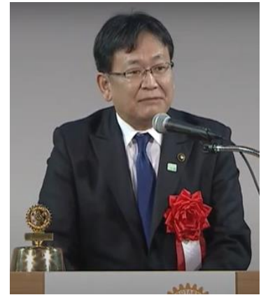
◇来賓祝辞 千葉市長 神谷 俊一 様