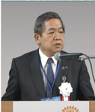
ガバナーエレクト 小倉 純夫 様