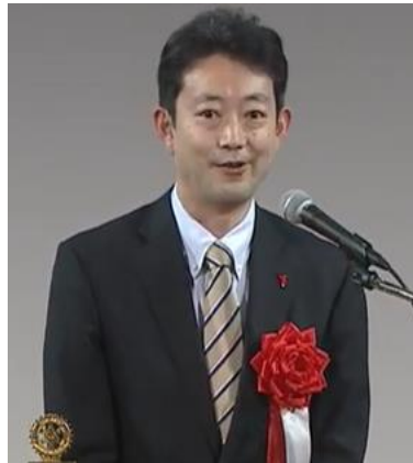
◇来賓祝辞 千葉県知事 熊谷 俊人 様