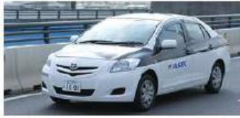
法人向けサービス