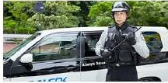
個人向けサービス