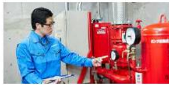
総合管理・防災事業